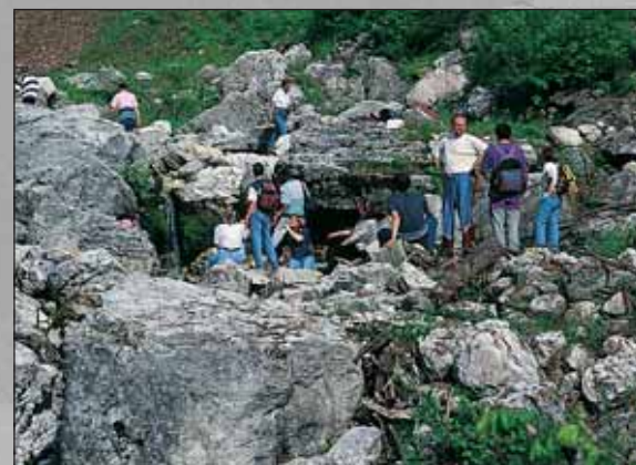
Skupina obiskovalcev v Bavišici