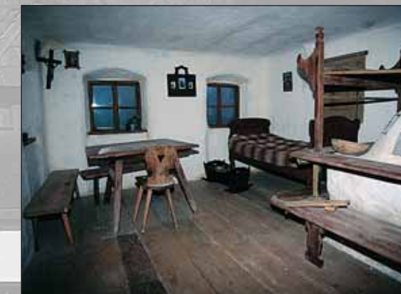
Notranjost kmečke hiše