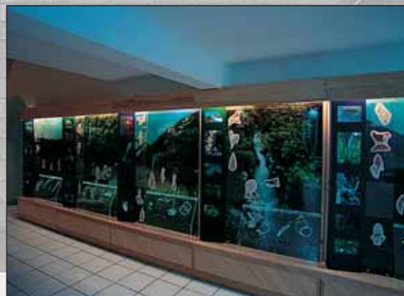
Predstavitev žive narave