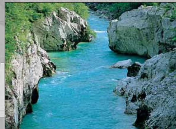
Soča v zgornjem toku