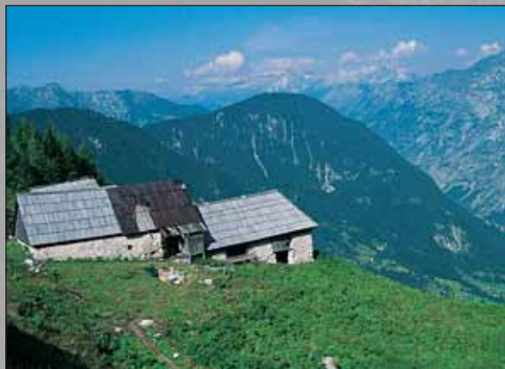
Planina Za skalo