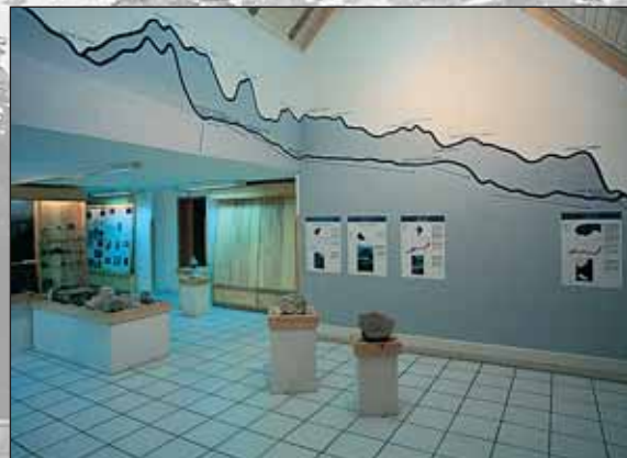
Vode med Triglavom in Bobinjem