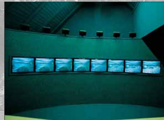
Videoinstalacija Skrivnosti Soče avtorja Andreja Zdraviča