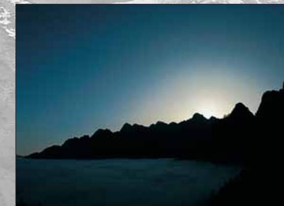
Gore Triglavskega narodnega parka ob sončnem vzhodu

DOM TRENTA je namenjen vam. V njem so predstavljene naravne posebnosti edinega narodnega parka v Sloveniji ter bogata etnološka dediščina doline Trente in Soče. Želimo, da bi ljubitelji, zagovorniki in poznavalci TNP radi prihajali v to hišo in se v njej počutili kot doma.