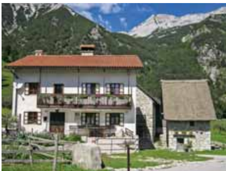
KOBARIŠKO-TOLMINSKI STAVBNI TIP

Za kobariško-tolminski stavbni tip je značilno združevanje posameznih enot domačije in povezovanje posameznih domačij v ohlapnejših oblikah (tudi z gradnjo v breg). Značilna je tudi mediteranska streha z blagim naklonom in poenotenjem kritine. Zunanji hodniki ( ganjki ) se raztezajo čez celotno daljšo fasado. Detajli so mediteransko oblikovani (kamniti