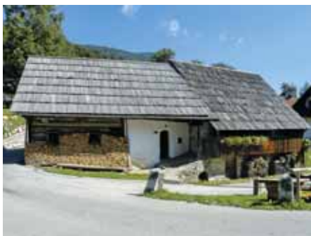
BOHINJSKI STAVBNI TIP

Za bohinjski stavbni tip , izoblikovan v 17. in 18. stoletju, so značilni stegnjena zasnova doma (pod skupno streho so povezani bivalni in gošpodarski prostori),