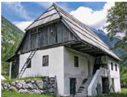
BOVŠKO-TRENTARSKI STAVBNI TIP

Bovško-trentarski stavbni tip , izoblikovan v 18. in 19. stoletju iz prvotnega alpskega tipa, opredeljujejo vrhkletna oziroma vrhhlevna zidana stavba masivnega videza, zunanje stopnišče s hodnikom pod širokim napuščem ( linda ), štrma dvokapna streha z izrazitimi čopi in z lesom opaženimi zatrepi ter leseno (prvotno sla-