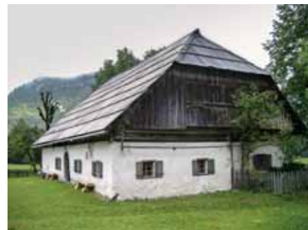
ZGORNJESAVSKI STAVBNI TIP

V dolini Radovne vidimo zgornjesavski stavbni tip , ki ga označuje gručašta zasnova domačije. Kmečka stanovanjska hiša je zidana, pritlična, s privzdignjenim podstrešjem, ali nadstropna. Stavbe imajo