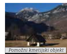
Pomožni kmetijski objekt