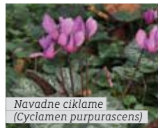
Navadne ciklame (Cyclamen purpurascens)