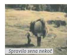
Spravilo sena nekoč