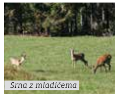
Srna z mladičema