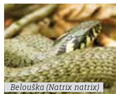
Belouška (Natrix natrix)