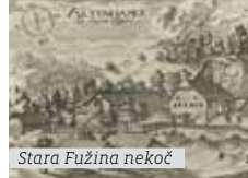
Stara Fužina nekoč

Fužina je bil prvotni industrijski obrat, v katerem so železovo rudo pretopili in s pomočjo oglja predelali v železo in jeklo.