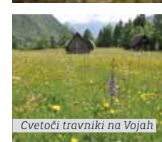
Cvetoči travniki na Vojah