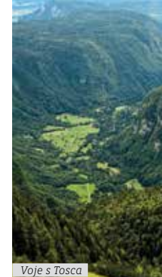
Voje s Tosca

Ponekod na Vojah lahko občudujemo tudi grbinaste travnike . Za njih so značilne grbine, površinske oblike, porasle s travo. Razvile so se najverjetneje z zakrasevanjem apnenčastega talnega morenskega gradiva. So geomorfološka zanimivost, travniki na njih pa so del kulturne dediščine, saj so se ohranili zaradi dolgoletne ročne košnje. Grbinasti travniki z izravnavanjem zaradi strojne košnje žal izginevajo iz naše krajine ali pa jih polagoma zaraščajo gozdovi. Zaradi umetnega gnojenja je osiromašena tudi siceršnja značilna pestrost rastlinskih in živalskih vrst na grbinah.