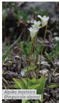
Alpska mastnica (Pinguicula alpina)