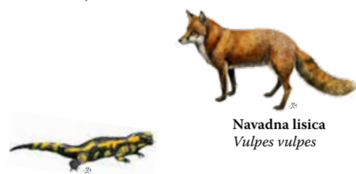
Navadna lisica Vulpes vulpes

Tukajšnji gozdovi nudijo zatočišče mnogim živalskim vrstam: srnjadi, jelenjadi, gamsom, muflonom, lisicam, jazbecem, polhom in številnim pticam.