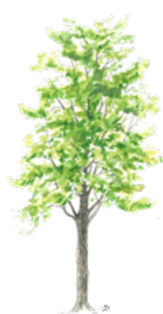
Črni gaber Ostrya carpinifolia

Gozdovi na območju Poključke soteske imajo poudarjeno varovalno funkcijo, zato se vanje praviloma ne posega in so prepuščeni naravnemu razvoju. Sestavljeni so iz gozdnih združb bukve, jelke, smreke, gorskega javorja ter grmišča črnega gabra in malega jesena s posameznimi alpskim nagnojem.