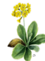
Avrikelj Primula auricula

Razmere v dolinskem delu soteske so podobne razmeram v mrazišču z obilico vlage, zato v soteski najdemo nekatere rastlinske vrste na znatno nižji nadmorski višini od njihovih običajnih rastišč. V začetnem delu soteske uspevajo navadno kresničevje, trpežna srebrenka, deveterolistna konopnica ... Višje najdemo rastline s pritlikavo in blazinasto rastjo, kot so burserjev, klinolistni in okroglostni kamnokreč, lepi jeglič ali avrikelj, scheuchzerjeva zvončica in druge.