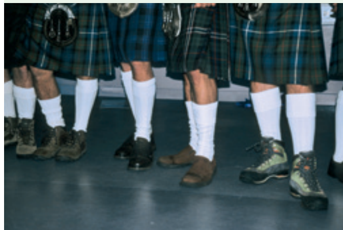
Nadzorniki v krilih (kiltih).