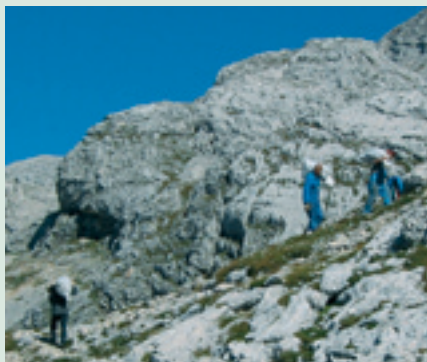
Utrinek s čistilne akcije na Kriških podih.