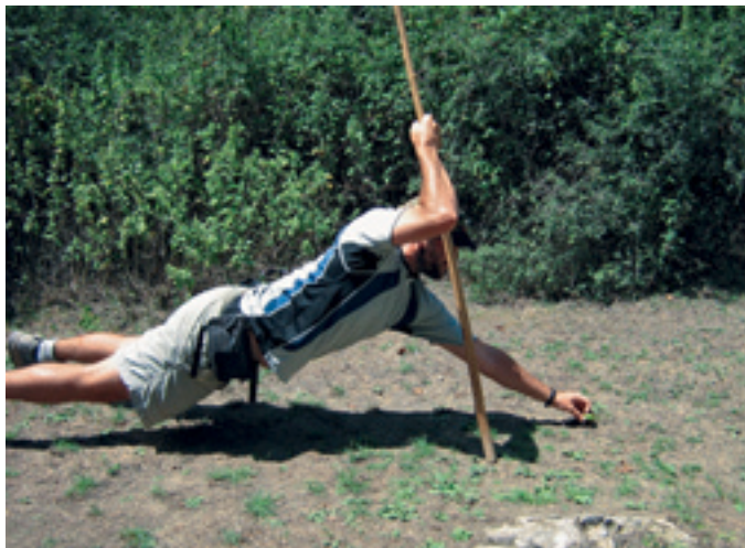
Stara pastirska igra – kdo dlje postavi kamen.

V tem času so nam tamkajšnji organizatorji in nadzorniki razkazali park skoraj v celoti. Vsak drugi dan smo si z avtobusom ali peš ogledali drug del parka, ki se nahaja na severu Španije, severno od Kantabrijskega gorovja in