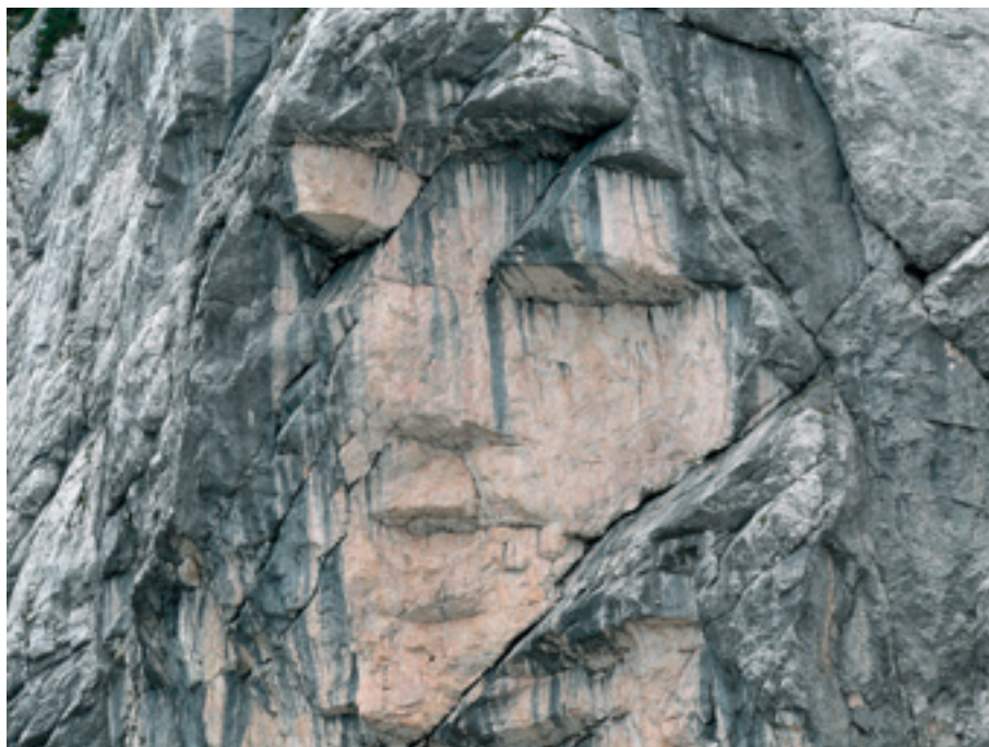
Ajdovska deklica.