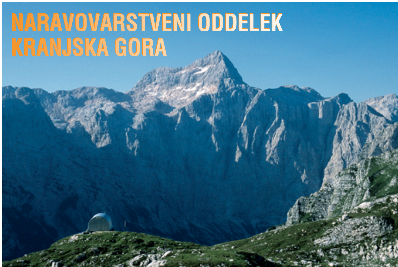
Bivak II Na Jezeru in Triglav.

Nadzor v Triglavskem narodnem parku opravljamo naravovarstveni nadzorniki, ki smo organizacijsko povezani v štiri oddelke. V prejšnji številki našega časopisa so se predstavili kolegi iz Bohinja, tokrat pa smo na vrsti »Zgornjesavci«.