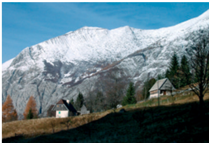
Vas Na Skali.