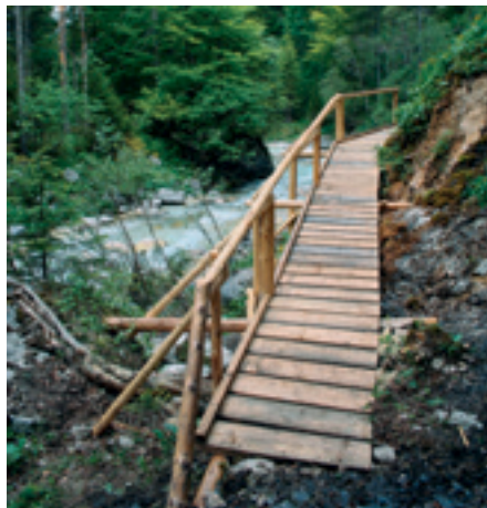
Nova brv v Vratih.