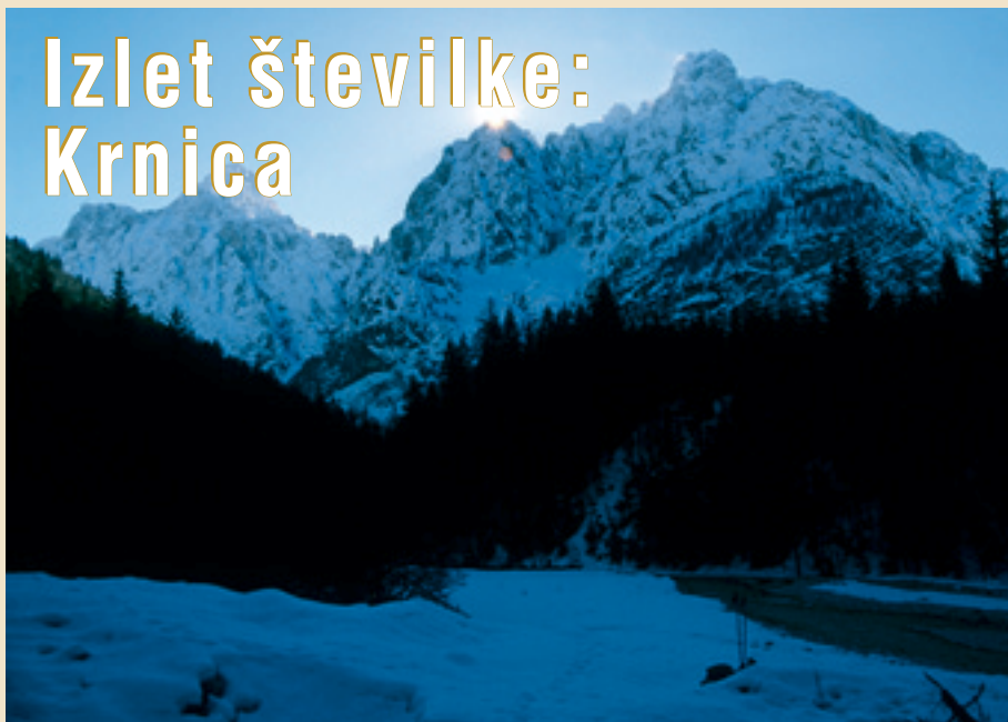
Na poti v Krnico.

Nekdanji hotel Erika (870 m) – planina Mali Tamar (960 m) – Koča v Krnici (1113 m)