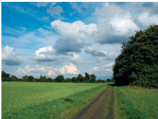
Tipična angleška pokrajina.