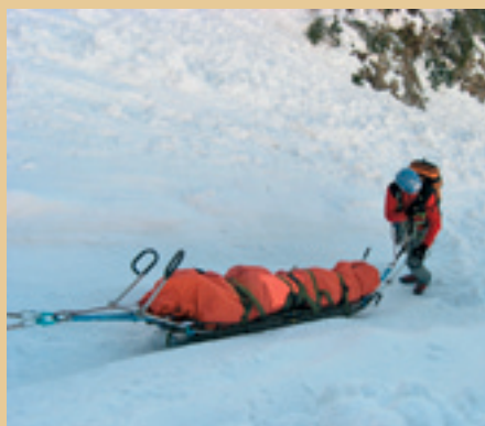
Zimska reševalna akcija.

Druga nevarnost, na katero moramo računati pozimi v gorah, so plazovi. Žal je pri nas še razširjeno mnenje, da plazovi ogrožajo predvsem turne smučarje. Analize nesreč zaradi plazov