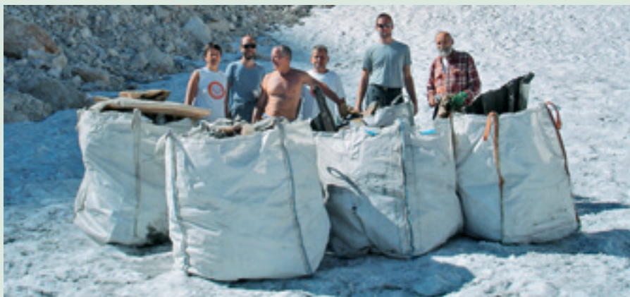
Čistilna akcija na Kredarici.

Odpadkov se je v treh desetletjih kljub olajševalnim okoliščinam nabralo veliko. Na skupni čistilni akciji TNP in članov ter prijateljev PD