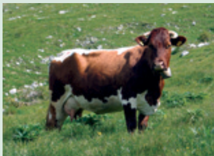
Miša (Skočir).