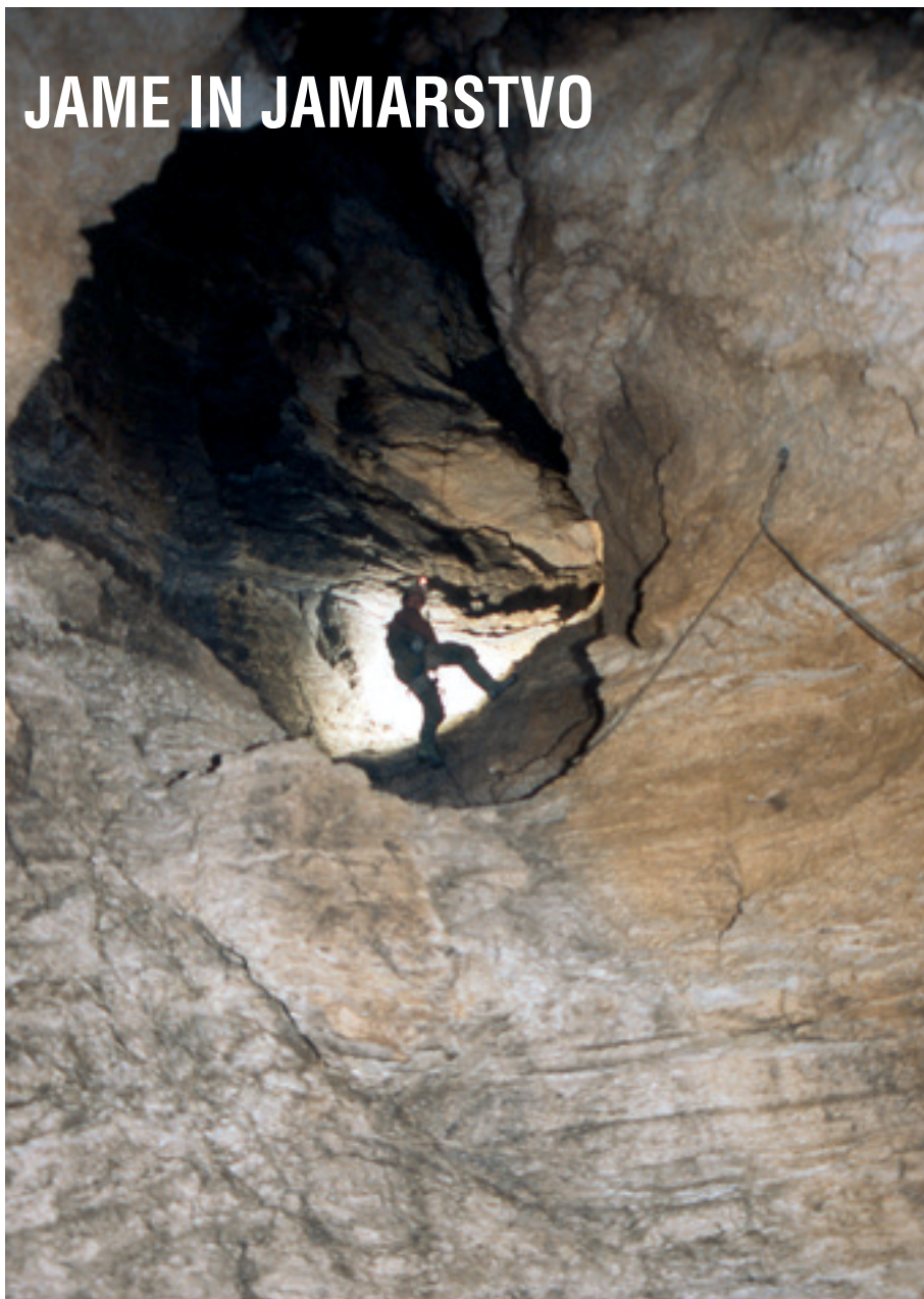
V jami Vrtnarija v Tolminskem Migovcu.