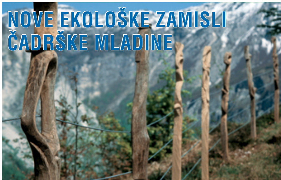
Ograja na Žlejšnu.