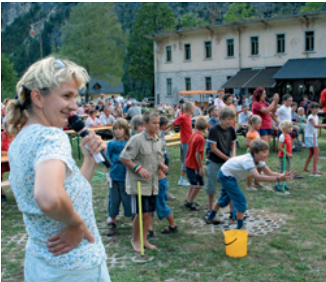
Trentarski senjem 2006.

Naša prva letošnja prireditev je bila namenjena otrokom: 3. februarja jih je obiskala vila Škratica, jih popeljala na sankanje in jih obdarila z lepimi darili, zaposleni v Domu Trenta pa smo jim pripravili lutkovno predstavo Krivopetnice in Zlatorog. Aprila smo gostili domačo gledališko skupino Trenta, ki nam je premierno uprizorila Linhartovo veseloigro Županova Micka. Kot vsako leto smo tudi letos z veseljem prisluhnili pevski reviji Primorska poje 2006, na kateri je svoj repertoar predstavilo šest pevskih zborov. »Dolino ob zgornji Soči skozi čas« nam je lepo prikazal avtor razstave Boris Dolničar. Razglednice iz davnega leta 1899 pa do današnjih so prikazovale Trento, Sočo in Lepeno. Razstava je bila na ogled od konca aprila do srede poletja.