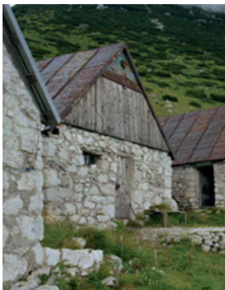
Biviak na planini Kal nam je večkrat olajšal raziskovanje Tolminskega Migovca.

Ali je v jamah zrak, ali se v jamah lahko diha? Ko greste v jamo, za sabo gotovo vlečete »špago«, da najdete pot nazaj. Kaj pa tiste grozne živali, netopirji, ki ti posesajo kri in se ti zapletejo v lase? Pa svetloba? Če vam ugasne luč - saj je premalo svetlobe, da bi našli pot nazaj ven. Taka vprašanja in trditve slišiš od staršev, prijateljev in znancev, ki ne morejo razumeti zakaj to nekoristno početje - to raziskovanje nekoristnega sveta. Ne razumejo, zakaj moraš v jamo polno ožin, blata, ledenih curkov mrzle vode, globokih brezen, ko pa bi lahko poležaval na toplem soncu pred vhodom in se pogovarjal s planinci, ki hodijo mimo. Bolj ko opisuješ užitek in zadovoljstvo ob premaganih ovirah in novoodkritih rovih, manj te razumejo.