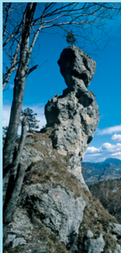
Poljanska kamena baba.

ni babi, »divje ali ta dolge jage«, ki z lovom seveda nima nobene zveze, morda nas bodo strašili berg mandeljci, špic parkeljci, ali pa bomo slišali o nesrečniku, ki so ga imeli namen pokopati še živega.