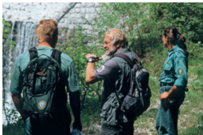
V dolini reke Tolminke.