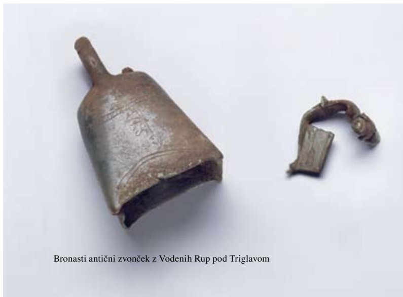
Bronasti antični zvonček z Vodenih Rup pod Triglavom

Na širšem območju ❹ planine Ovčarija ležijo štiri arheološka najdišča. Poznoantična točka leži nad Štapcami. Na Vodenih Rupah so bili odkriti tudi ostanki dveh koč iz rimske dobe, v katerih so se ohranile lončenina ter bronaste zaponke za spenjanje oblačil. Zraven so našli še okrašen bronast zvonček z vrezanim napisom URS, ki dokazuje pašništvo v rimskem obdobju. Spodnji del planine Ovčarija in prostor nad Štapcami sta značilno rudarsko območje iz zgodnjega novega veka. Celotno površje je prekopano s površinskimi rudnimi jamami, ohranili pa so se tudi ostanki starih tlakovanih poti.