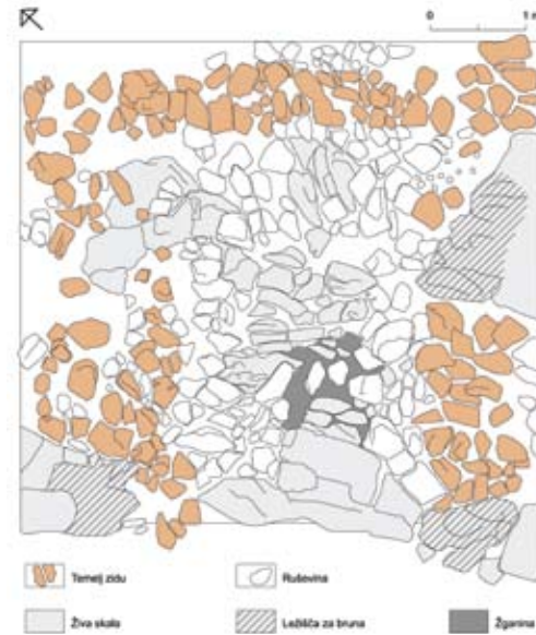
Kamniti temelji poznoantične stavbe v Kalu na Zadnjem Voglu

V srednjeveškem dokumentu oglejskega patriarha je omenjen tako imenovani transalpinski prehod med Bohinjem in Posočjem. Vodil je čez Škrbino vzhodno od Podrte gore in je veljal za strateško najpomembnejšo tovorno pot. Na robu planine Za Migovcem so še dobro ohranjeni ostanki te tlakovane poti.