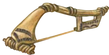
Bronasta zaponka iz 5. stoletja po Kr., najdena na planini Klek

Nad 4 Lipanco na jugozahodnem pobočju Lipanskega vrha leži obširno območje velikih površinskih rudnih jam. Na njihovih robovih lahko najdemo značilno rudo bobovec, kot ji pravijo domačini. Bobovci leže tudi na planinski poti čez Brdo do Debele peči. Naključna najdba bronastega bodala iz 13. stoletja pr. Kr. pod Mrežcami dokazuje obljudenost planine že v bronasti dobi. Na planini Zgornje Brdo, ki je prekopana s površinskimi rudnimi jamami, so dobro vidni ostanki temeljev pozno srednjeveških in novoveških stavb. Nad gozdno mejo visoko nad planino so se še ohranili ostanki srednjeveških tlakovanih poti, po katerih so tvorili nakopano rudo.