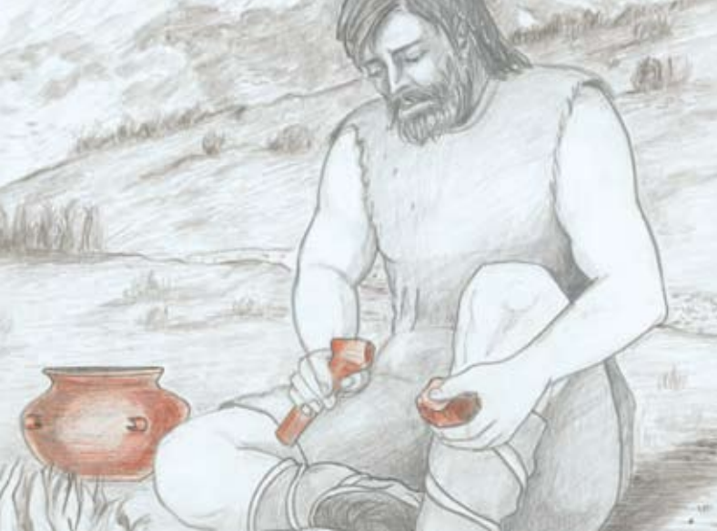
Obiskovalci gora v bronasti dobi

V bližini ognjišča so našli črepinje lončenih posod, kamniti puščici in strgala. Na območju Lepe Komne so se sledi rudarjenja ohranile kot ogromne prekopane površine – ovalne rudne jame s premerom in globino do nekaj metrov. Med Komno in Krnom ni sledov rudarjenja, kajti med prvo svetovno vojno je bilo to površje prekopano zaradi vojaških poti, tovornih žičnic in številnih vojaških stavb.