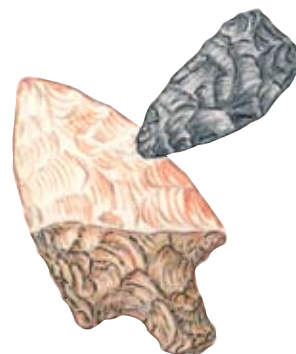
Kamniti puščici z Lepe Komne

Pravljica o Zlatorogu pripoveduje o rudnih zakladih pod goro Bogatin ter o iskalcih zlate in železove rude. Zgodba odseva velik pomen rudarjenja v visokogorju in obenem kaže na obljudenost 2 Komne že v starih časih. Na planini Poljanica so z arheološkimi raziskavami odkrili postojanko iz bronaste dobe.