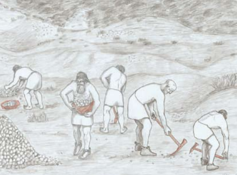
Površinsko kopanje železove rude v najstarejših obdobjih

5 Rudno polje in sosednja Rudna dolina sta dobila ime po površinskih rudnih jamah, ki so še danes značilnost gozdnega površja severno in zahodno od vojaškega izobraževalnega središča. Pisni viri dokazujejo, da je bilo Rudno polje središče rudarjenja na Pokljuki v srednjem in novem veku. Železova ruda je na tem območju zelo kakovostna in različnih oblik. Najdemo jo ob planinski poti proti Triglavu, številne lokacije pa so izginile zaradi površinskih izravnjav pri gradnji smučišča in biatlonskih prog. Rude niso kopali le na površini, ampak tudi v rudarskih rovih, dostopnih po navpičnih jaških. V stoletjih sta te jaške prekrila odpadlo vejevje in tenka plast gozdne ruše.