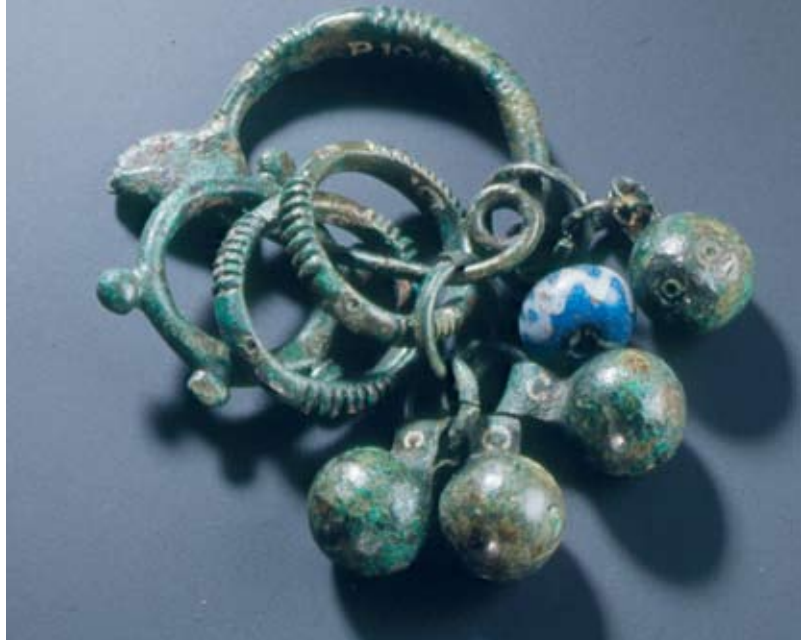
Svetolucijska bronasta zaponka z obeski iz Bohinjske Bistrice.

V Gorenjskem muzeju odkrivamo, dokumentiramo ter raziskujemo nova arheološka najdišča in pozabljena rudna nahajališča na območju vzhodnih Julijskih Alp: Pokljuke, Triglavskega pogorja, Spodnjih Bohinjskih gora, Jelovice in Bohinja. Izsledki dosedanjih arheoloških raziskav so podlaga za visokogorske kulturno-pohodniške poti, imenovane Železna pot. Pot je speljana po najpomembnejših območjih starega rudarstva, železarstva in pašništva.