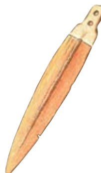
Rekonstrukcija bronastodobnega bodala s planine Lipanca

Na Medvedovcu, severno od planine 4 Javornik , prekopano gozdno površje dokazuje intenzivno rudarsko dejavnost v poznem srednjem veku. Levo in desno od stare tovarne poti, ki vodi proti Lipanci, ležijo značilne površinske rudne jame. Tu je še vedno mogoče najti najkakovostnejšo železovo rudo – bobovec. Bobovci so zaobljena svetleča zrna različnih velikosti, rjave do sive barve. Zelo širok, toda plitev okrogel nasip tik ob poti je ostanek spiralice železove rude. V njej so s pomočjo nametane snega ali v poletnem dežju prali in spirali blato z nakopane rude.