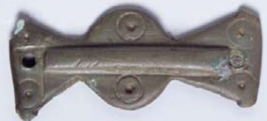
Vojaški pasni okov iz 5. stoletja po Kr. s Poljanice na Zadnjem Voglu