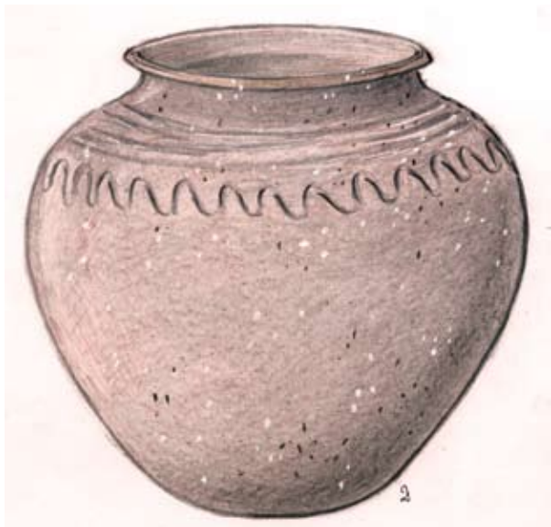
Rekonstrukcija poznoantične posode iz Zgornje Krme

Prvi obiskovalci gora so bili verjetno iskanci rude, nabiralci, lovci ali pastirji. Sončna pobočja nad Poljem so bila od nekdaj primerna tudi za pašo; tu lahko opazimo umetno zravnane terase. Na teh terasah so vidni temelji stavb, v bližini katerih so našli odlomke posod iz pozne antike.