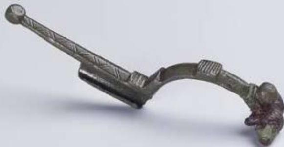
Rimska bronasta zaponka s planine Klek