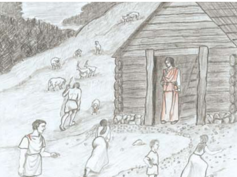
Rekonstrukcija poznoantične stavbe v Kalu na Zadnjem Voglu

V srednjeveškem dokumentu oglejskega patriarha je omenjen tako imenovani transalpinski prehod med Bohinjem in Posočjem. Vodil je čez Škrbino vzhodno od Podrte gore in je veljal za strateško najpomembnejšo tovorno pot. Na robu planine Za Migovcem so še dobro ohranjeni ostanki te tlakovane poti.