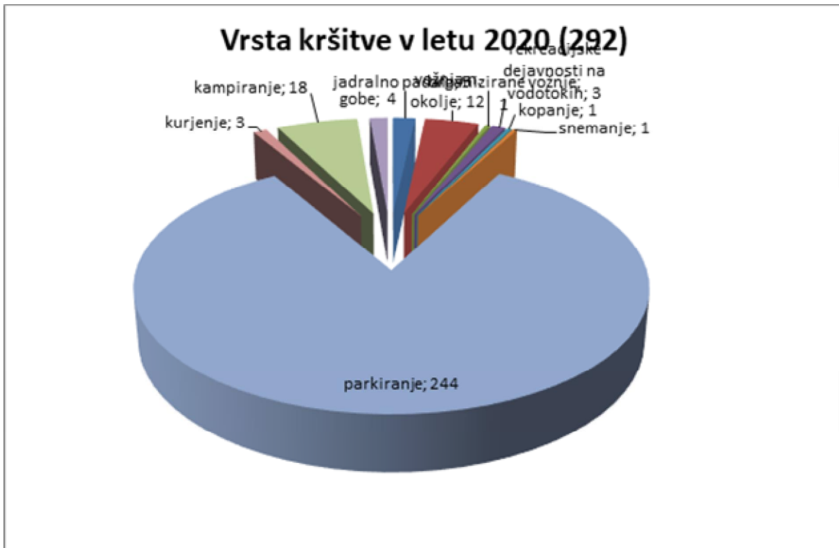
Slika 2: Pregled kršitev, glede na vrsto kršitve, v letu 2020