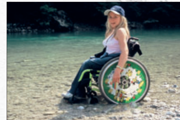
Pri sotočju rek Soče in Tolminke

Uprava parka je obisku funkcionalno oviranih oseb delno prilagojena. Tu smo vam na voljo z dodatnimi informacijami, ogledate si lahko priložnostne razstave in Malo informacijsko središče. P E