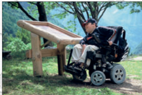
Pri Kugyjevem spomeniku

1. Cerkev sv. Katarine stoji na sončnem pobočju Homa nad Zasipom pri Bledu. Do nje se je mogoče pripeljati z avtomobilom, ponuja pa čudovit razgled na Dolino. P M E C